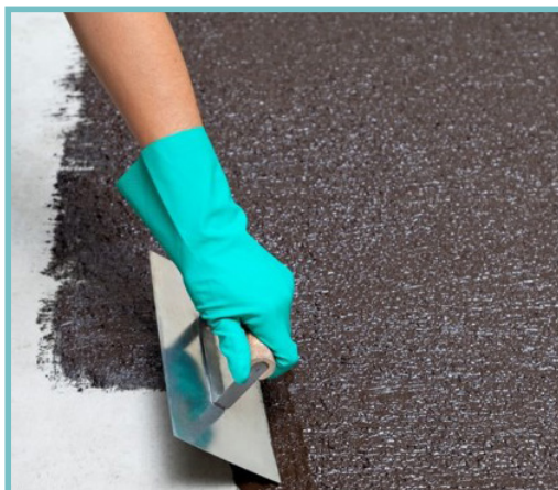
Emulsão Viapol Antirruído® sistema aderido

Estruturada com não tecido de fibra de vidro produzida com asfalto especial, acoplada à geotêxtil de alta gramatura, na espessura de 3 mm. Com amortecedor de impacto e propriedades acústicas, apresenta significativa redução acústica entre pavimentos, ou seja, reduz o barulho entre os pavimentos de edifícios.