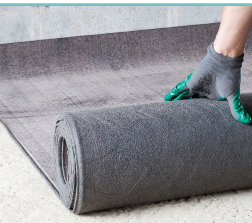
Manta Viapol Antirruído® 3 mm sistema flutuante

Estruturada com não tecido de fibra de vidro produzida com asfalto especial, acoplada à geotêxtil de alta gramatura, na espessura de 3 mm. Com amortecedor de impacto e propriedades acústicas, apresenta significativa redução acústica entre pavimentos, ou seja, reduz o barulho entre os pavimentos de edifícios.